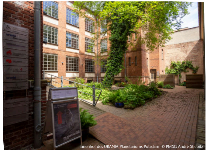
Innenhof des URANIA-Planetariums Potsdam

Weitere Informationen unter https://www.spsg.de/schloesser-gaerten/angebote-fuer-gaeste-mit-handicap/