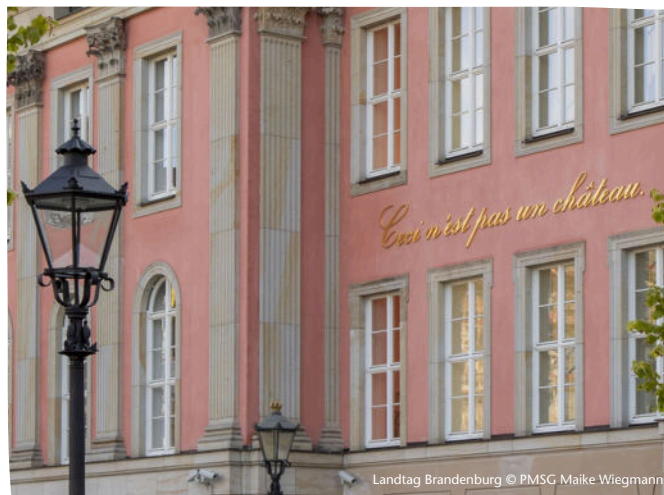
Landtag Brandenburg

Weitere Informationen und Anmeldung unter https://nano-potsdam.de/