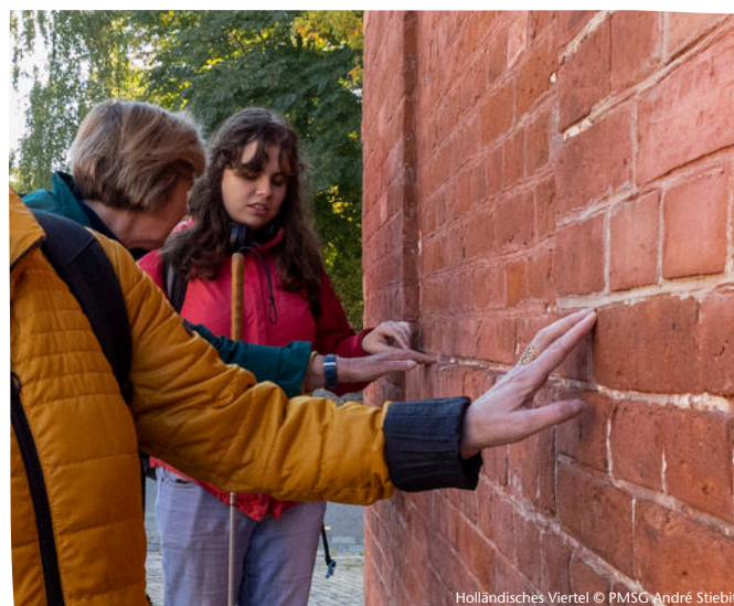
Holländisches Viertel

Dauer 2,5 Stunden Buchbar ganzjährig Gruppenpreis (bis 12 Personen) 185 €