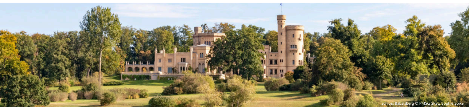
Schloss Babelsberg

Für eine bessere Lesbarkeit gelten in diesen Angeboten die grammatikalisch maskulinen Personenbezeichnungen gleichermaßen für Personen jedes Geschlechts.