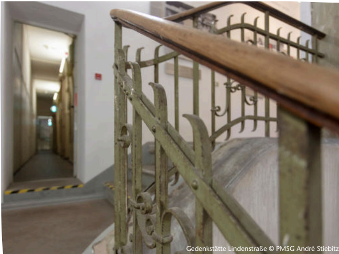
Gedenkstätte Lindenstraße