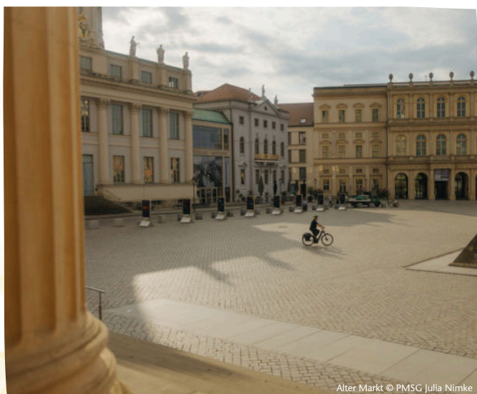
Alter Markt