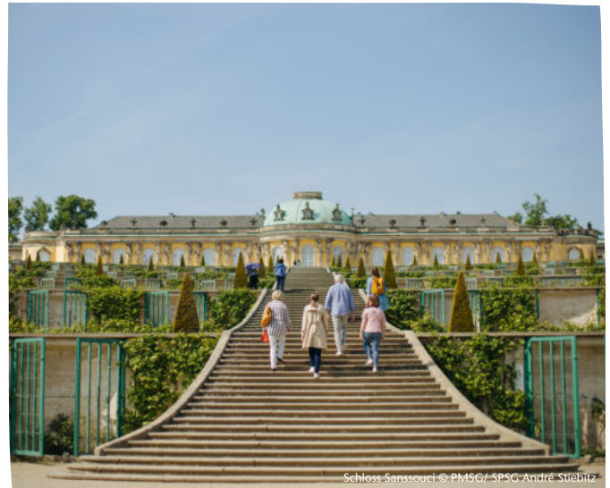
Schloss Sanssouci

Dauer 2,5 Stunden Buchbar ganzzjährig Gruppenpreis (bis 40 Personen) 150€