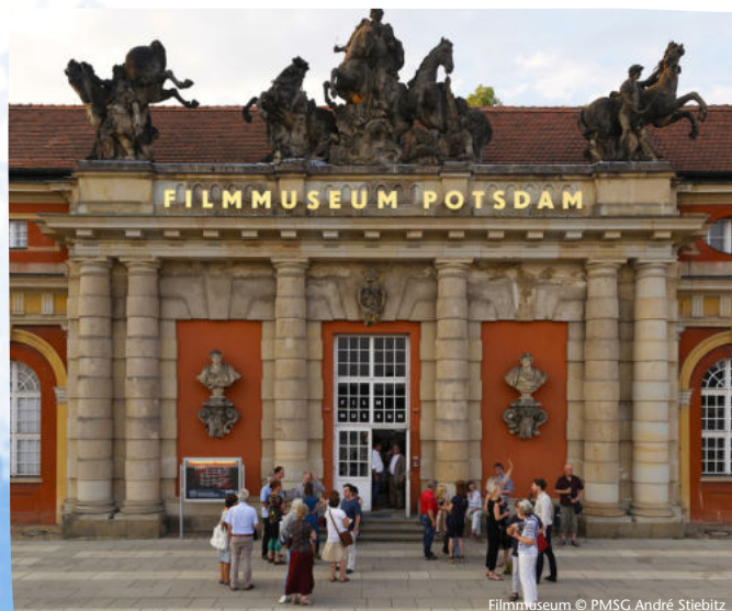
Filmmuseum © PMSG André Stiebitz

Dauer 2,5 Stunden Buchbar ganzjährig Gruppenpreis (bis 20 Personen) 150€