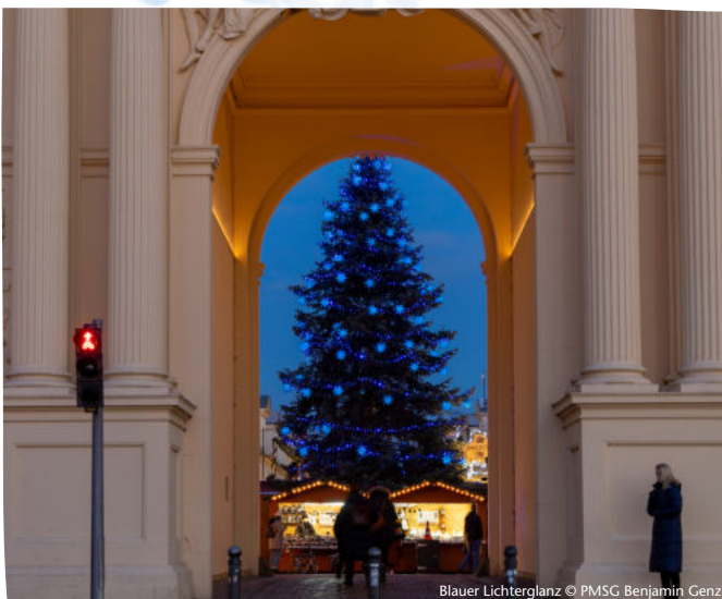
Blauer Lichterglanz

Unser Winterspaziergang durch den Park Sanssouci ist der Klassiker unter den Spaziergängen in der kalten Jahreszeit. Der Spaziergang führt durch den winterlichen Park Sanssouci, vorbei an der Historischen Mühle, der Orangerie, dem Chinesischen Haus bis zu den Weinbergterrassen. Den Höhepunkt bildet die Innenbesichtigung des Schlosses Sanssouci (mit dem Audioguide).