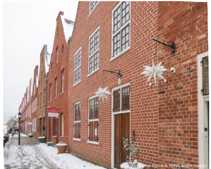
Holländisches Viertel

Dauer 1,5 Stunden Buchbar Nov. - Mrz. Preis pro Person (10 bis 15 Personen) 24€