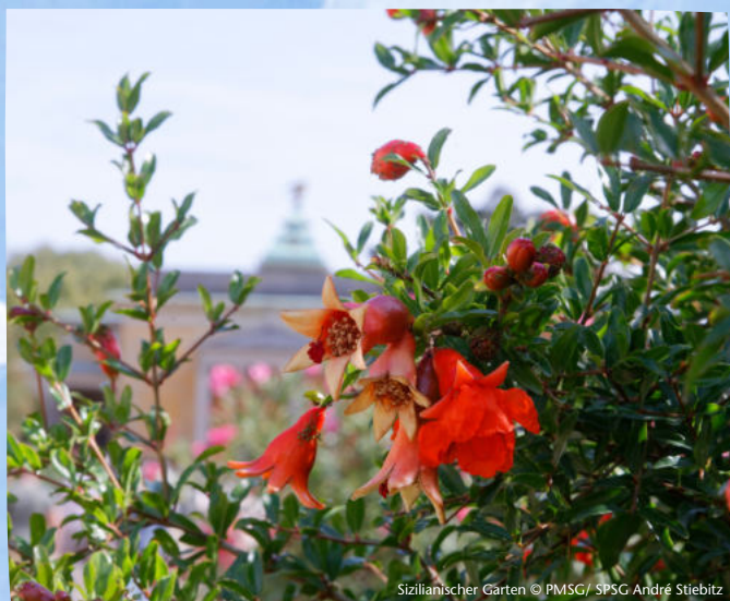
Sizilianischer Garten

Dauer 2 Stunden Buchbar ganzjährig Gruppenpreis (bis 20 Personen) 130€