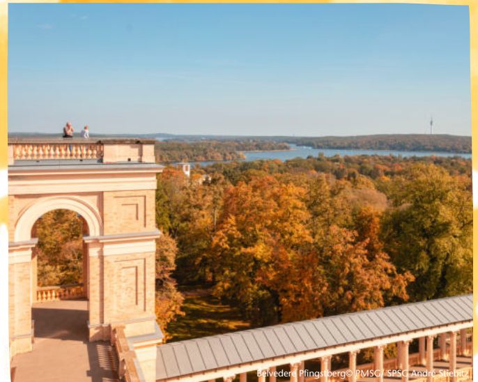
Belvedere Pflingstberg

Dauer 1 Stunden Buchbar ganzjährig Gruppenpreis (bis 20 Personen) 110€