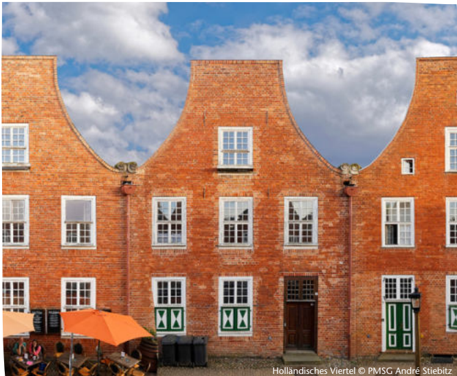
Holländisches Viertel