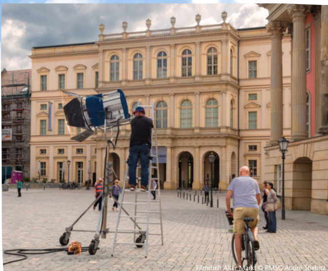
Filmdreh Alter Markt