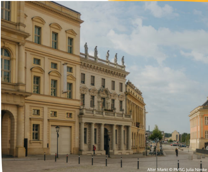
Alter Markt

Sie haben keine Zeit für einen eigenen Besuch in Potsdam? Dann lauschen Sie doch unseren Geschichten im Dein Potsdam-Podcast. Anne und Alexandra plaudern in der ersten Episode der 8. Staffel über das erlebbare Europa in Potsdam. Doch Achtung: Reinhören könnte Reise Sehnsüchte wecken!