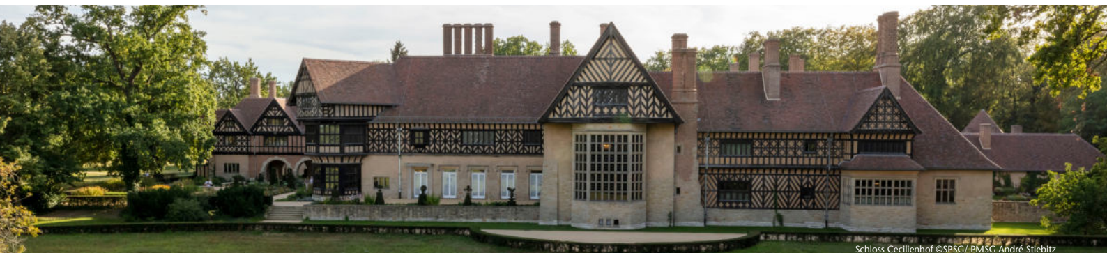
Schloss Cecilienhof