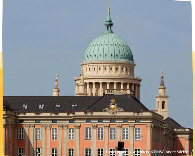
Landtag und Nikolaikirche

Dauer 2 Stunden Buchbar ganzjährig Gruppenpreis (bis 20 Personen) 130€